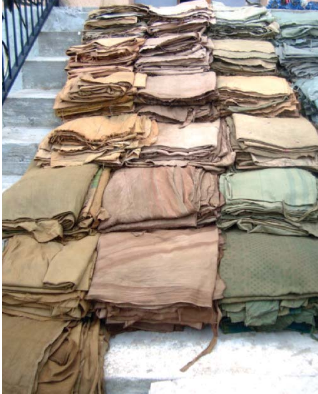
на фото: підготовка тканини