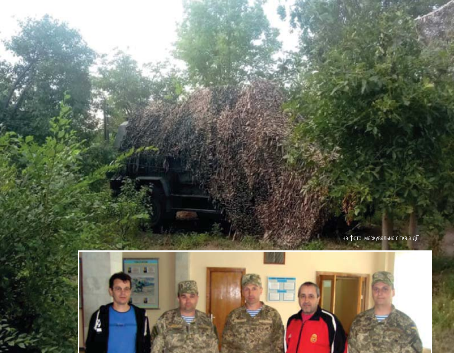
на фото: маскувальна сітка в дії